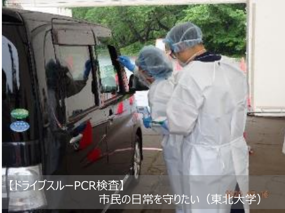
【ドライブスルーPCR検査】 市民の日常を守りたい（東北大学）