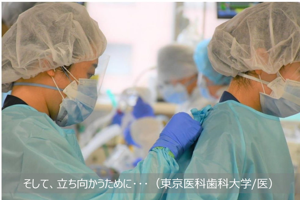
そして、立ち向かうために・・・（東京医科歯科大学/医）