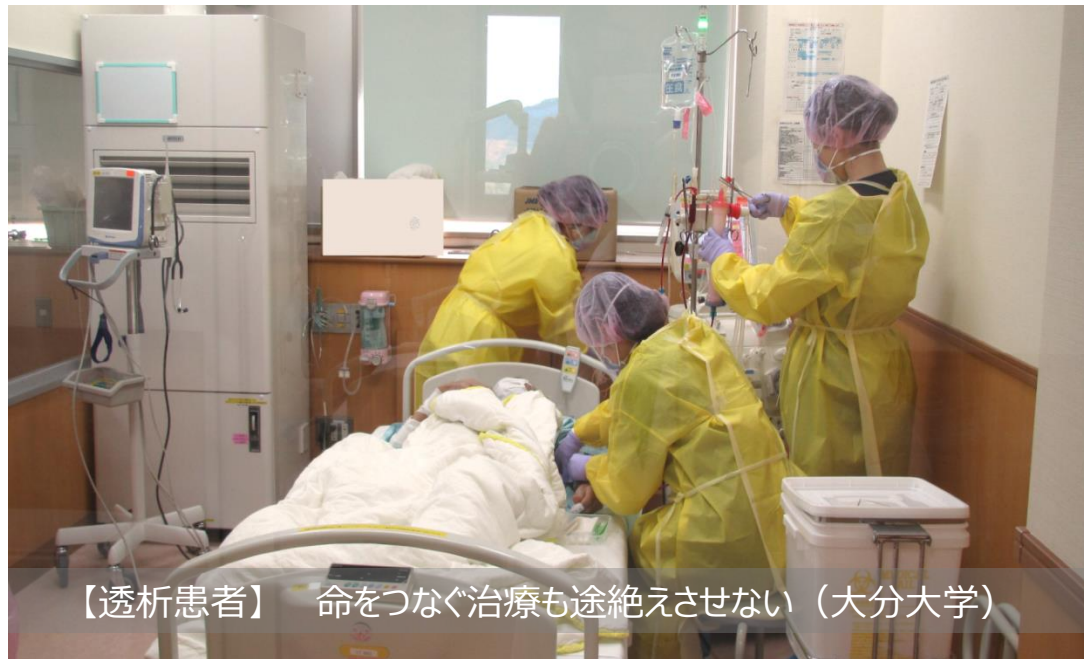
【透析患者】 命をつなぐ治療も途絶えさせない（大分大学）