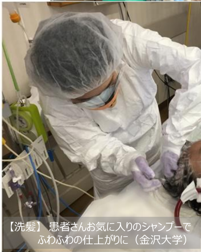
【洗髪】 患者さんお気に入りのシャンプーで ふわふわの仕上がりに（金沢大学）