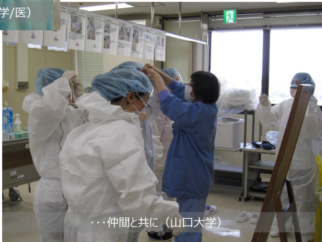
・・・仲間と共に（山口大学）