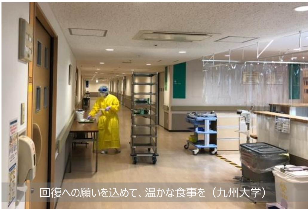
回復への願いを込めて、温かな食事を（九州大学）