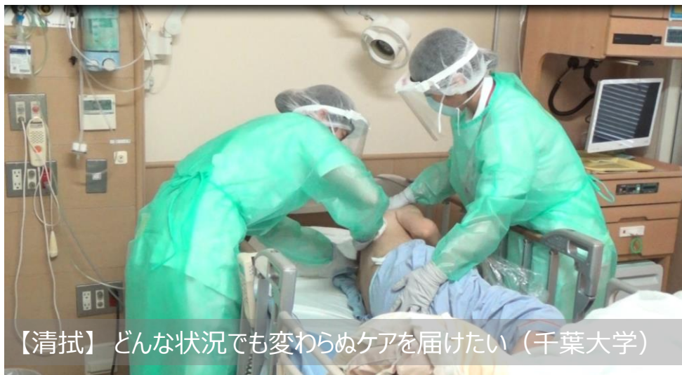
【清拭】 どんな状況でも変わらぬケアを届けたい（千葉大学）