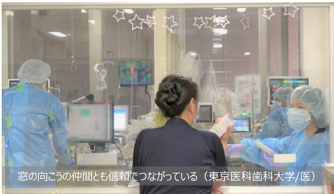
窓の向こうの仲間とも信頼でつながっている（東京医科歯科大学/医）