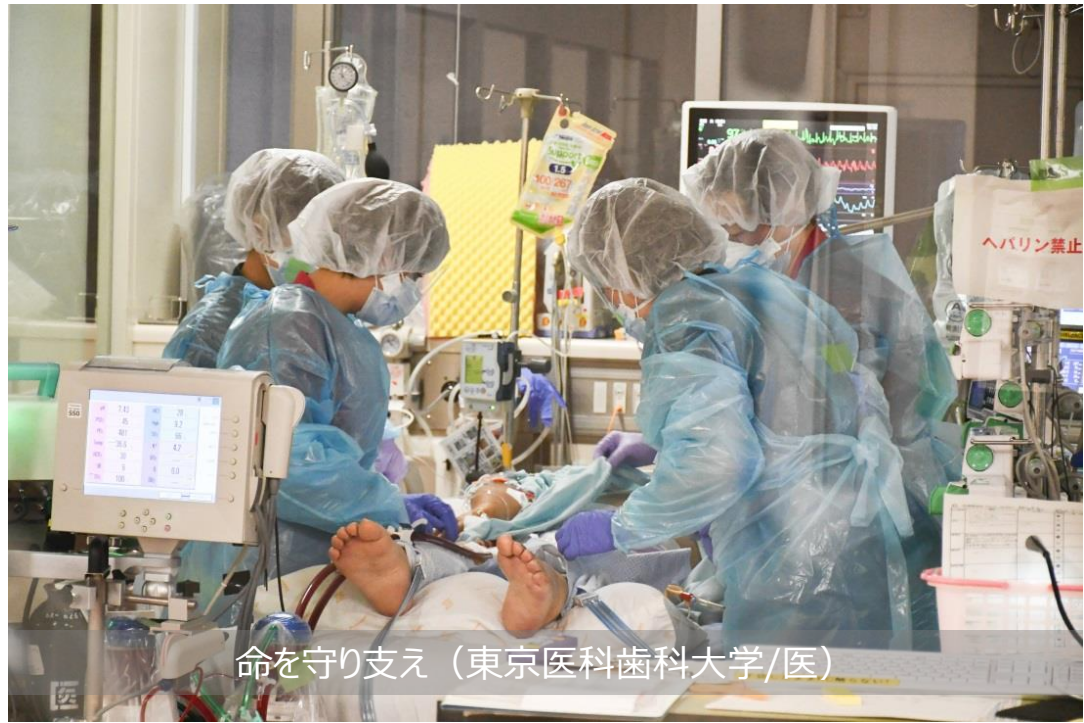
命を守り支え（東京医科歯科大学/医）