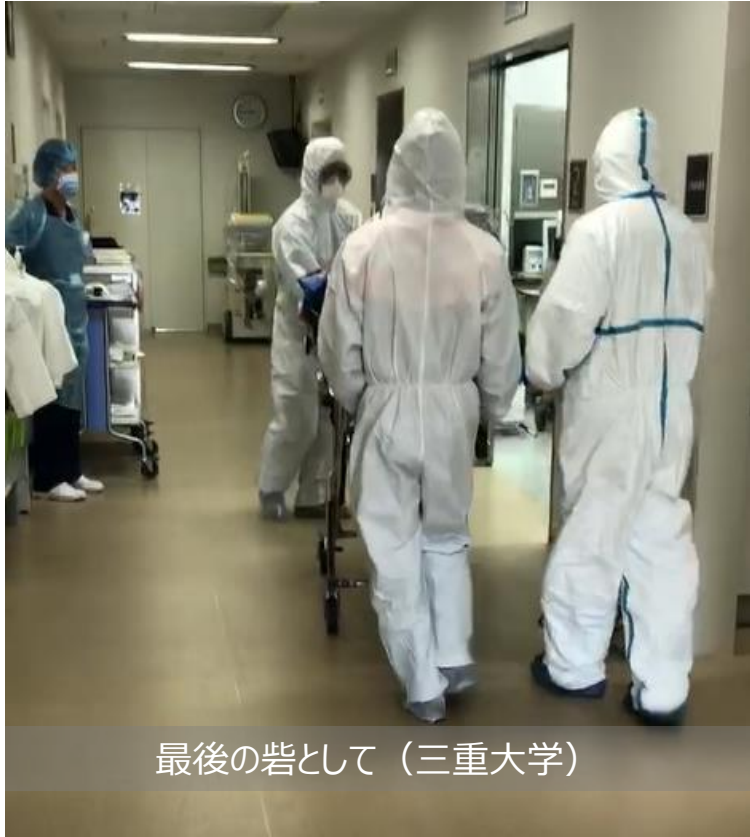
最後の岩として（三重大学）