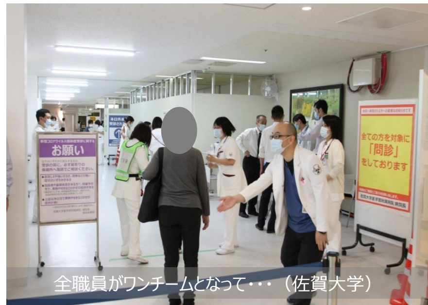
全職員がワンチームとなって・・・（佐賀大学）