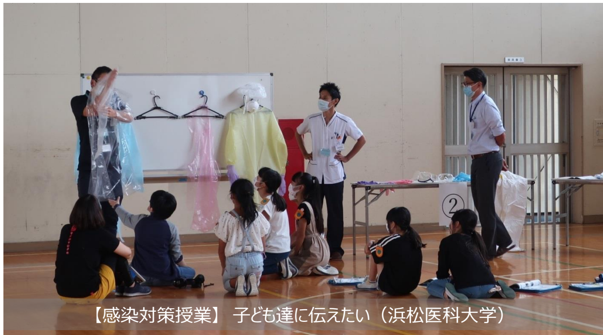
【感染対策授業】 子ども達に伝えたい（浜松医科大学）