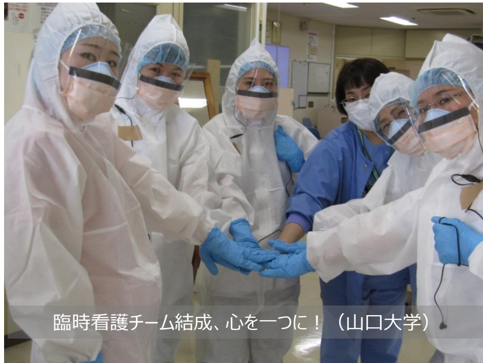
臨時看護チーム結成、心を一つに！（山口大学）